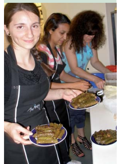
Vorbereitungen für den türkischen Abend.

Sie können einen Abschlussbericht sowie das Programm, die Teilnehmenden, Vortragenden und vieles mehr auf der Website des Projekts einsehen: Unter www.workshop-in-berlin.de finden Sie auch Kontaktmöglichkeiten um Brigitte Lüdecke persönlich zu erreichen.