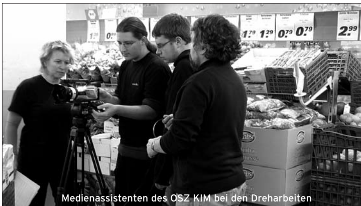
Medienassistenten des OSZ KIM bei den Dreharbeiten

Auf das Ergebnis dürfen wir gespannt sein! Der Kurzfilm wird auf dem Neujahrsempfang des Quartiersmanagements am 28. Januar 2010 (siehe Seite 2) erstmals der Öffentlichkeit präsentiert. Am 24. Februar 2010 zeigt das OSZ KIM den Film am Tag der Offenen Tür zwischen 14 und 18 Uhr. Der Film wird ebenfalls auf www.deinkiez.de zu sehen sein, außerdem werden DVDs über das Quartiersbüro in der Drontheimer Straße 22 an die Beteiligten verteilt - Sie kennen bestimmt jemanden, bei dem Sie den Film einmal ausleihen können!